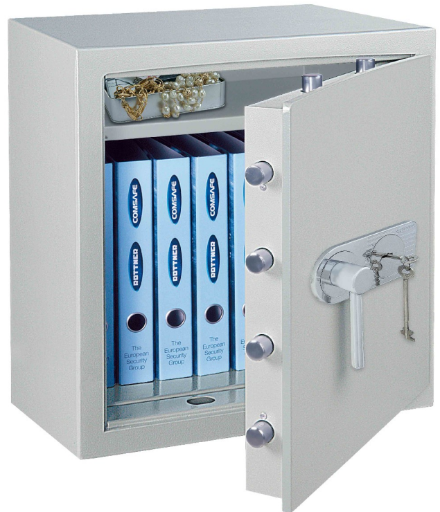
OPD 65 Premium mit DB