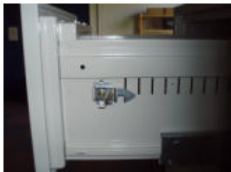
Sperrhebel einer anderen Lade in Position 1

Die Lade mit Sperrhebel in Position 1 lässt sich nur öffnen wenn die oberste Lade entriegelt und mindestens 2 cm herausgezogen ist.