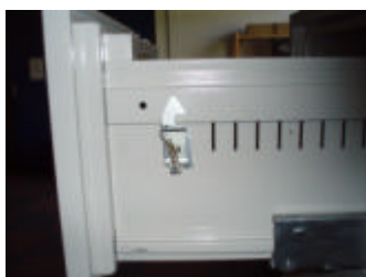
Sperrhebel in Position 2

Lade mit Sperrriegel in Position 2 lässt sich unabhängig von der obersten Lade öffnen.