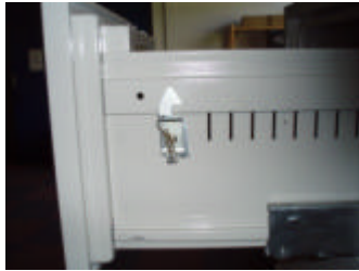
Zentraler Sperrhebel (oberste Schublade) in Position 2

Der zentrale Sperrhebel um individuelles öffnen der Laden zu ermöglichen befindet sich rechts an der oberen Schublade.